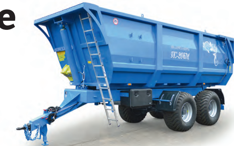
Новинка 2018 года — тракторный полуприцеп ПС-20БМ грузоподъемностью 20 тонн

– «Ярославичу» свойственно динамичное развитие. Об этом свидетельствует освоение новых моделей, поэтому предприятие