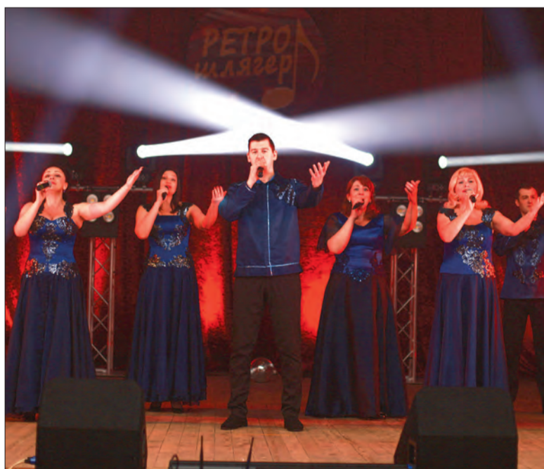
Вокальный ансамбль «Настроение» Ивняковского КСЦ

Специальные дипломы присуждены участникам за лучшее исполнение песни из репертуара народной артистки СССР Людмилы Георгиевны Зыкиной и из репертуара ВИА «Песняры».