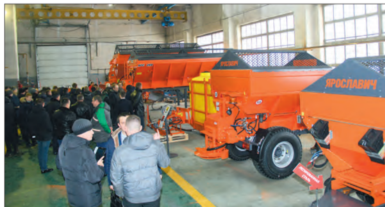
На выставке — дорожно-коммунальная техника