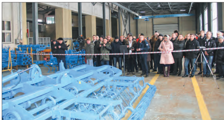
Знакомство с новым 15-метровым культиватором

Поездка в Ярославль запомнилась дилерам не только деловой частью, но и гостеприимством хозяев. Гости совершили автобусную экскурсию по достопримечательностям древнего города, побывали в спектакле «Ревизор» в первом русском театре имени Федора Волкова.