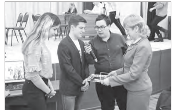
Дебатировать будущие лидеры