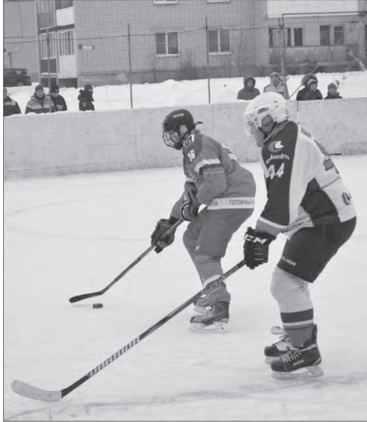
Борьба за шайбу

На хоккейных кортах в селе Туношна и поселке Дубки взрослые сражались в первенстве ЯМР по хоккею с шайбой «Кубок главы ЯМР-2019». В Туношне местный «Олимп» принимал команду из Ивняковского сельского поселения. Команда из Ивняков первые 15 минут первого периода играла на равных, по ходу второ-