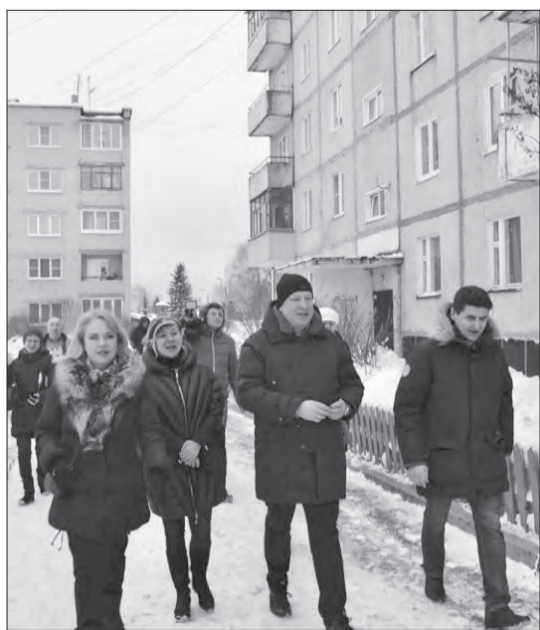
Выездное совещание в Михайловском