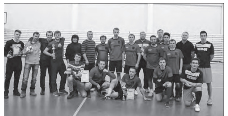
На церемонии награждения

Следующий мини-футбольный сезон начнется осенью,