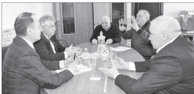
Участники рабочего совещания за круглым столом

Собравшиеся обсудили вопросы агропромышленной отрасли. Актуальность темы обусловлена тем, что областная Дума и правительство области выступили с предложением объявить 2020 год Годом села.